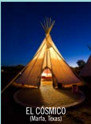
EL CÓSMICO (Marfa, Texas)

Esto quiere decir que es el hotel que espero visitar muy pronto. Se trata de un destino único, distante y casi místico que alberga a la Fundación Judd (Donald Judd fue el artista contemporáneo que donó su colección y estudio, ubicado éste en una antigua base militar). La apertura este verano de su casa/museo/estudio en Soho, Nueva York, su obra y sus esculturas triple-stacked que me hacen suspirar, pero también el plan de dormir in the middle of nowhere sin las comodidades de un hotel cinco estrellas ni las celebridades y los paparazzi de costumbre, hacen que quiera ir ¡pero ya!